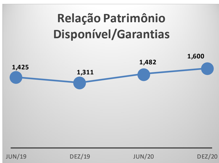
Gráfico 5.3.2 – Relação Patrimônio Disponível/Garantias

No gráfico seguinte, observa-se a evolução da relação patrimônio disponível e garantias nos últimos quatro semestres.